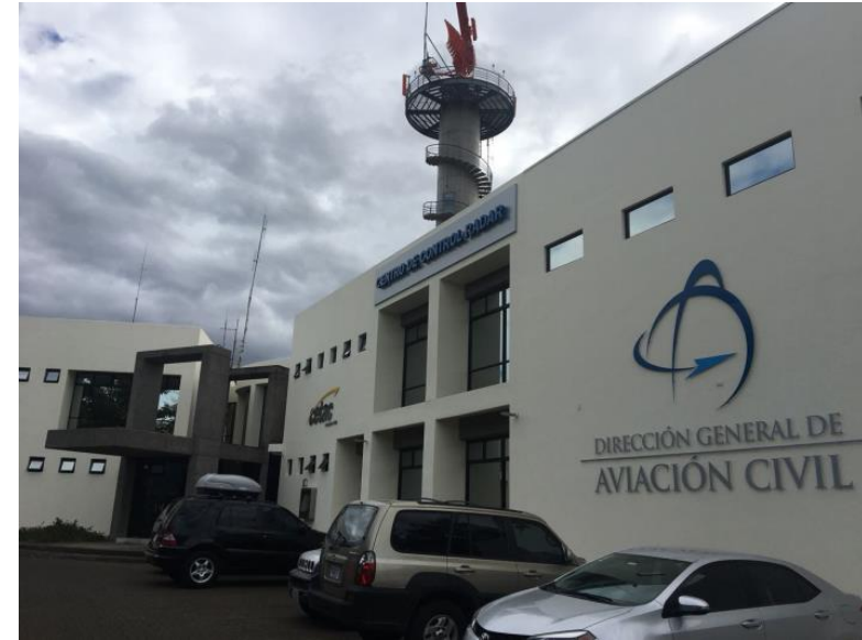
Nuevo Centro control de Radar