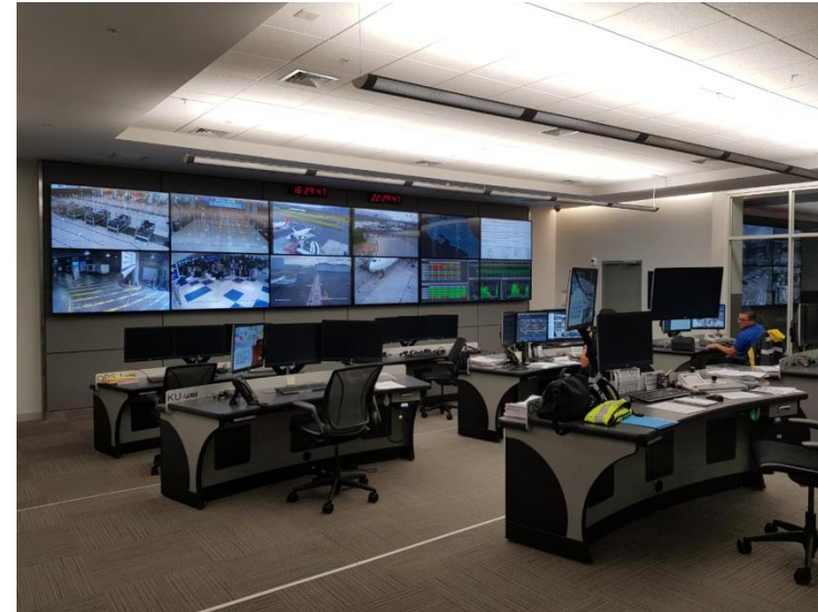
Centro de Operaciones y Comunicaciones