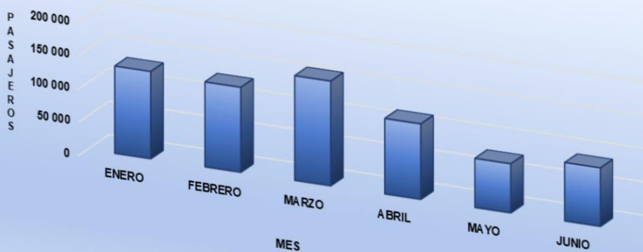
GRÁFICO N° 2. COSTA RICA: DIRECCIÓN GENERAL DE AVIACIÓN CIVIL UNIDAD DE PLANIFICACIÓN INSTITUCIONAL AEROPUERTO INTERNACIONAL DANIEL ODUBER QUIRÓS PASAJEROS INTERNACIONALES, POR MES 1° SEMESTRE 2019